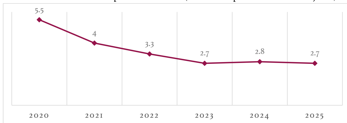
Gráfica 1. Tasa de desocupación en México (corte correspondiente al mes de junio)